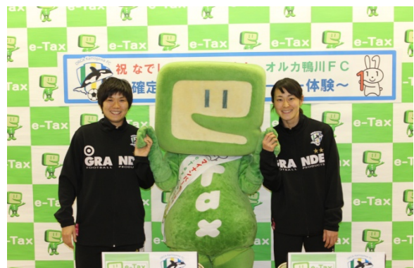
申告書作成体験を終え、笑顔でイータ君と写真撮影