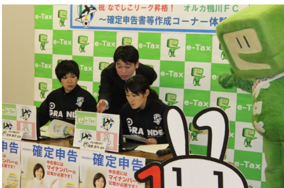
申告書作成体験をする北本監督(左)と高橋選手(右)