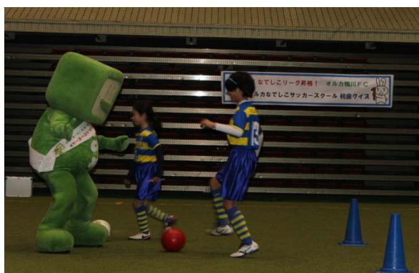
イータ君をかわしてドリブルするスクール生たち