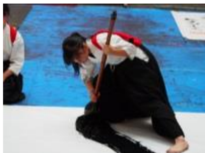
書道パフォーマンスの様子