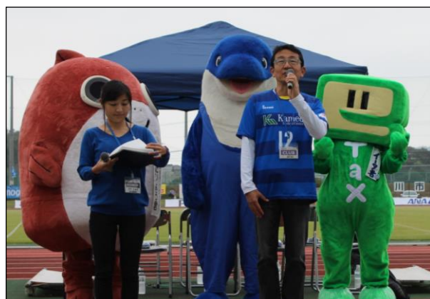
キックオフセレモニーに参加するイータ君たち