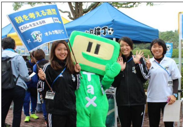
育成チーム「オルカ鴨川BU」の選手と一緒に