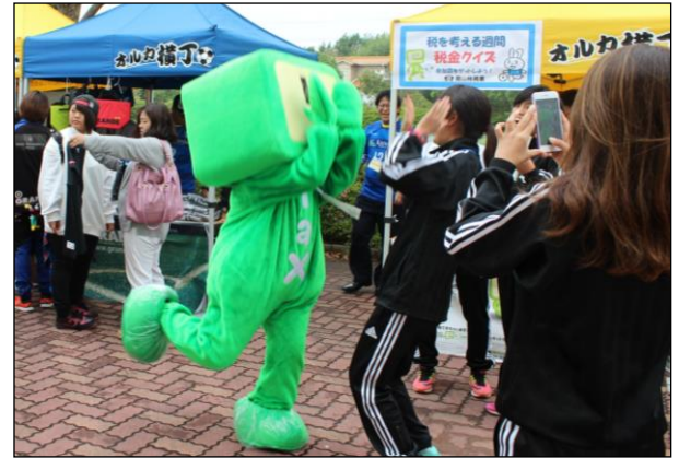
クイズ参加者とハイタッチ！