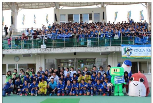
クロージングセレモニーで選手、サポーターと写真撮影