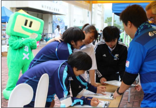
大好評だった「税を考える週間 税金クイズ」