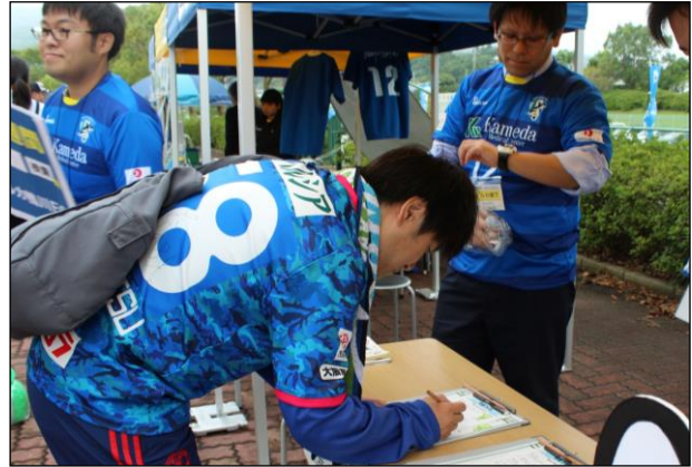
アウェイチームのサポーターもクイズに挑戦