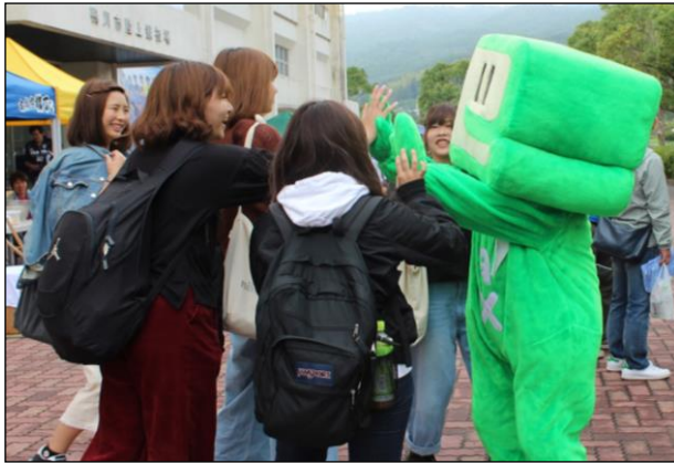
なぜかこの日は若い女性に大人気のイータ君