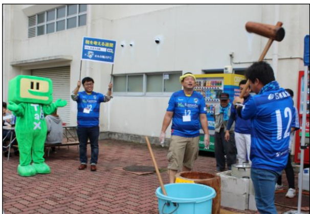
もちつき大会にも参加したイータ君