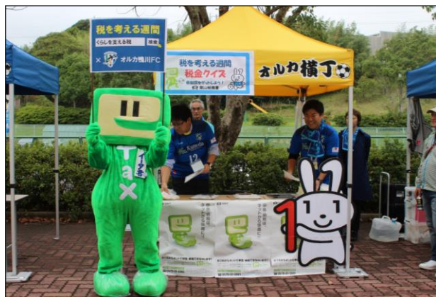
オルカ横丁に開設された「税を考える週間 税金クイズ」ブース