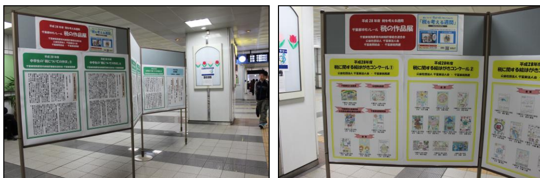
昨年の「千葉都市モノレール 税の作品展」の様子

※ この企画は、「税を考える週間」（11月11日～17日）の広報活動の一環として、千葉都市モノレール㈱の協力の下、実施いたします。