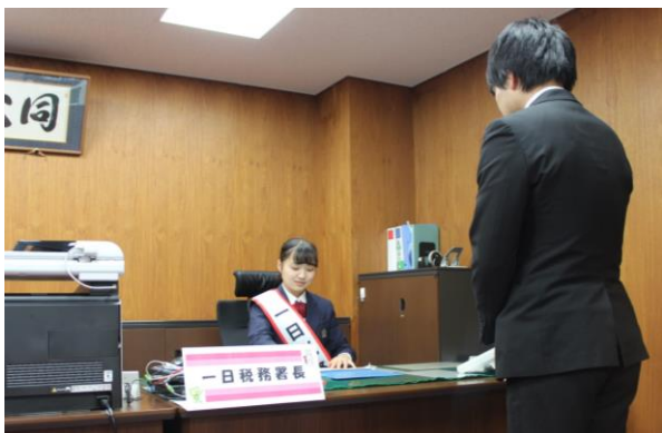
一日税務署長としての決裁業務を体験