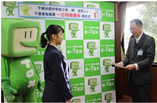
梶山署長から委嘱状が交付されました