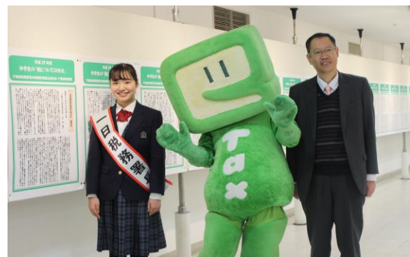
「税の作品展inそごうギャラリー」を視察する岡さん(左)と梶山署長(右)