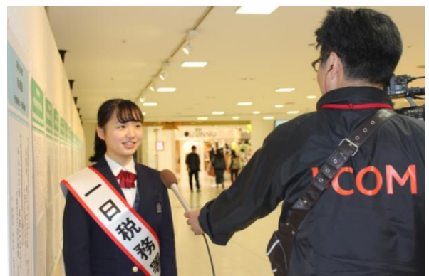
CATVの取材も受けました