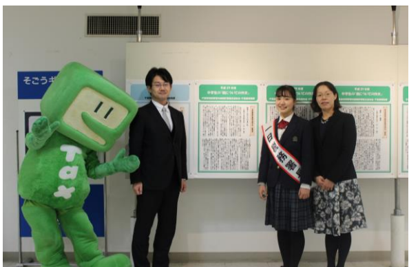
展示されている自分の作文の前でご両親と一緒に