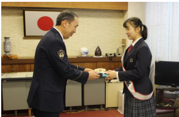
千葉東警察署を表敬訪問し、警察署長と名刺交換