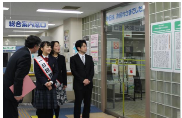
署内視察で、自分の作文が掲示されているのを発見