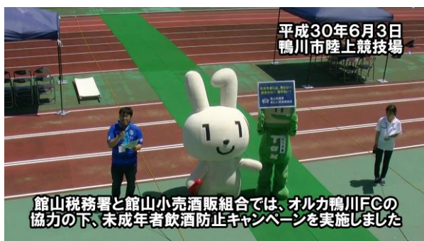
イータ君とマイナちゃんによる協力の呼びかけ