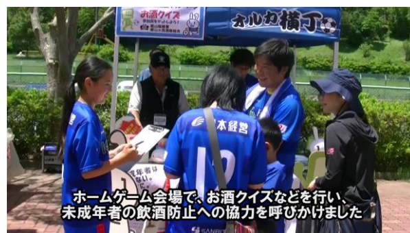
オルカ横丁での「お酒クイズ」