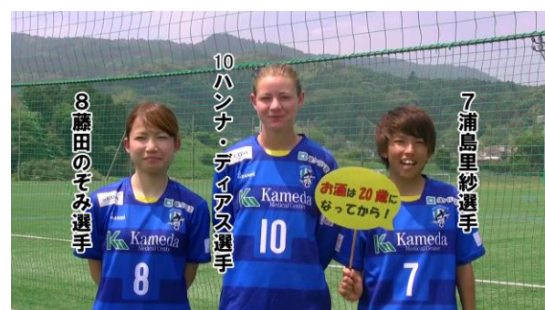
主力選手による未成年者飲酒防止のコメント