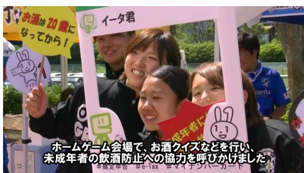
大好評だった「SNS映えする撮影会」